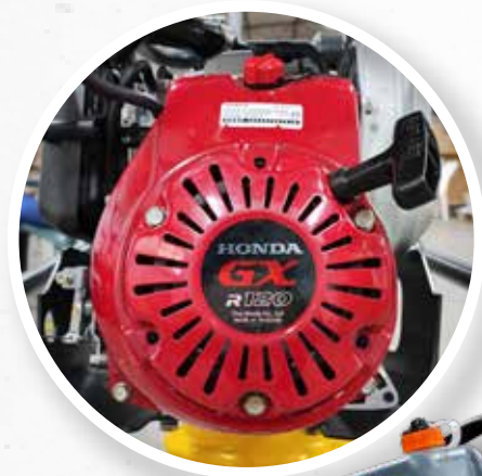
MOTOR HONDA GXR120